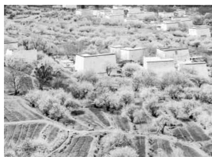
十里桃林与梯田、村落相映成趣。