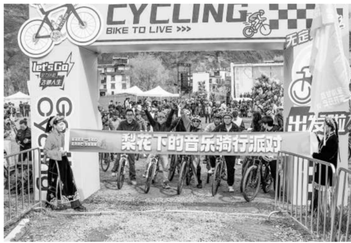
骑行派对活动现场。

清泉注入装置,水光流转间,“清泉润泽沃土,众志成城宏图”的美好愿景清晰呈现,传递出乡村携手发展的坚定信念。随着发令枪响,梨花下的音乐骑行派对正式发车。骑手们从海子坪出发,沿着村寨间的蜿蜒道路,穿行在