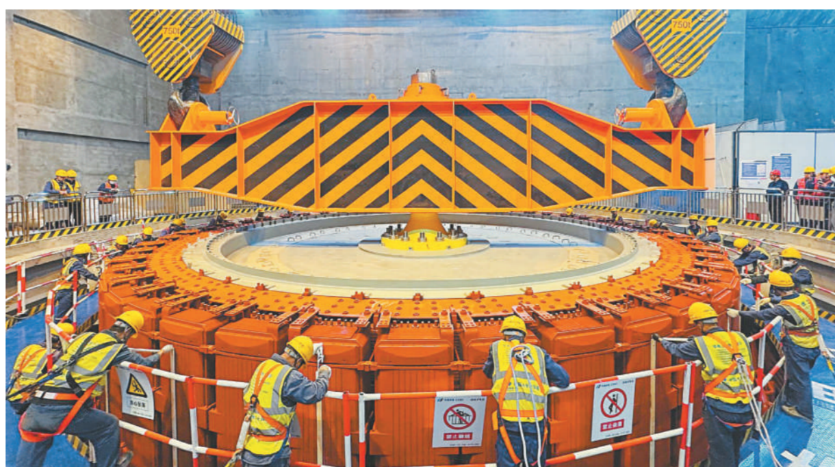
拉哇水电站首台机组转子成功吊入机坑。

据了解,拉哇水电站计划今年11月实现导流洞下闸,年底首批机组具备投产发电条件。电站全容量投产后每年平均发电量为90亿千瓦时,每年可节约标准煤约277万吨、减少二氧化碳排放741万吨,将有效支撑国家主要流域风光一体化先行基地建设和清洁能源外送。