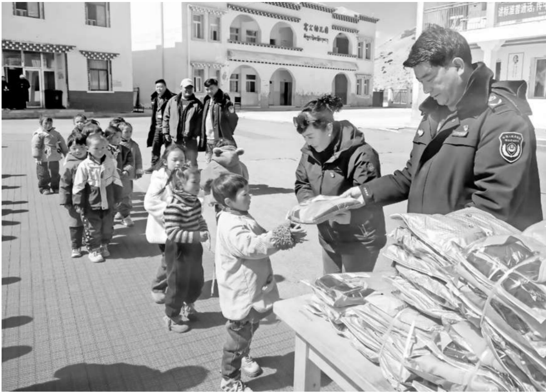
德格县政协为窝公中心小学发放校服。

今年以来，州政协紧扣省委“经济大省挑大梁”要求，立足三江流域实际，统筹政协委员、专家、基层工作者等组建“推动三江流域经济高质量发展”“发展助农产业，促进乡村振兴”专项调研组，深入乡镇村寨、产业园区等地，与群众、企业负责人、基层干部面对面交流，收集痛点难点、听取民意诉求，开展精准研判，为破解发展瓶颈、夯实振兴根基提供