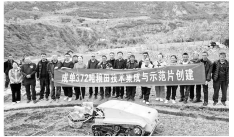
“成单372”吨粮田技术集成与示范片建设机播现场会。

本报讯 4月11日至12日，州种子管理站在泸定县冷碛镇尖茶坪村召开“成单372”吨粮田技术集成与示范片建设机播现场会。省州县农技专家与尖茶坪村种植户齐聚田间地头，现场观摩玉米精量机播、种肥同播等关键技术，共商吨粮田建设与粮食单产提升路径。