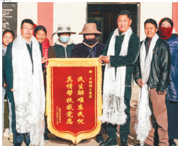
热瓦村村民向中国稀土集团的帮扶表达感谢。