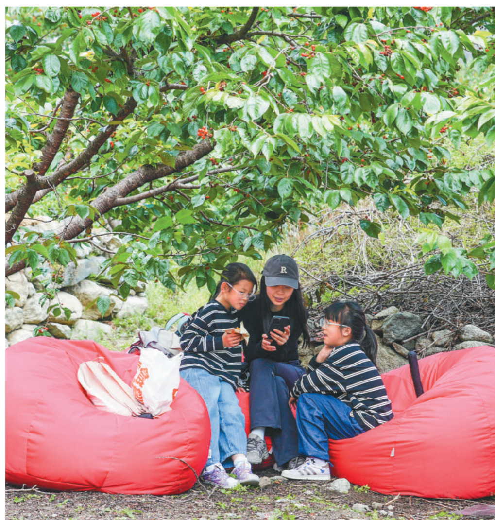
游客在“樱桃躺”上享受亲子时光。