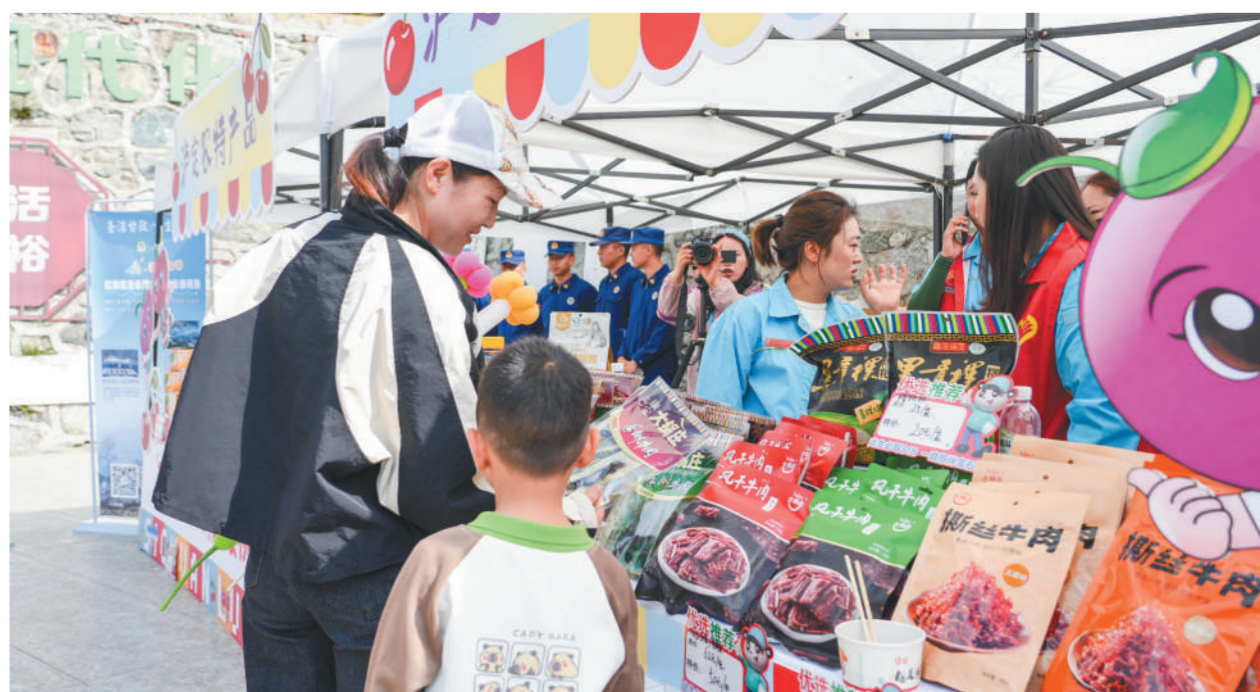
游人在特产区选购当地特产。

本报讯 4月25日,以“樱为有你 甜满泸定”为主题的“泸定2026年红樱桃采摘体验季”在该县冷碛镇杵坨村启幕。数千名游客齐聚大渡河畔,共赴这场集农商文旅体于一体的春日盛宴,在清甜果香中感受泸定的自然风光与红色底蕴。