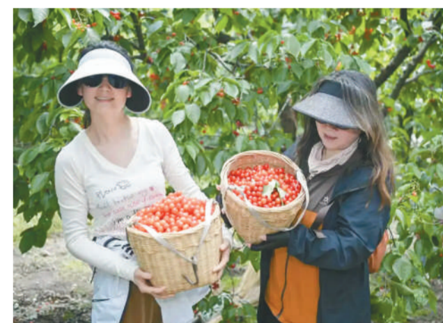
游人采摘樱桃乐呵呵。