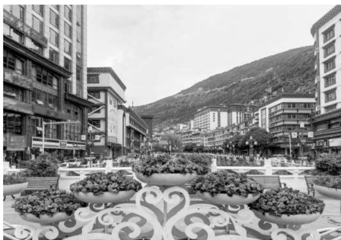
装扮一新的康定城。