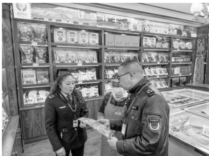
执法部门严查商家。

随着“圣洁甘孜·一生有约”终身门票政策及配套措施持续落地见效，今年“五一”假期，我州预计迎来文旅客流高峰。连日来，我州聚焦文旅惠民、市场整治、服务保障、文旅供给四大重点任务，统筹文旅、公安、市场监管、交通等多部门协同发力，全方位筑牢假期文旅安全防线，保障游客安全、舒心、便捷出行。