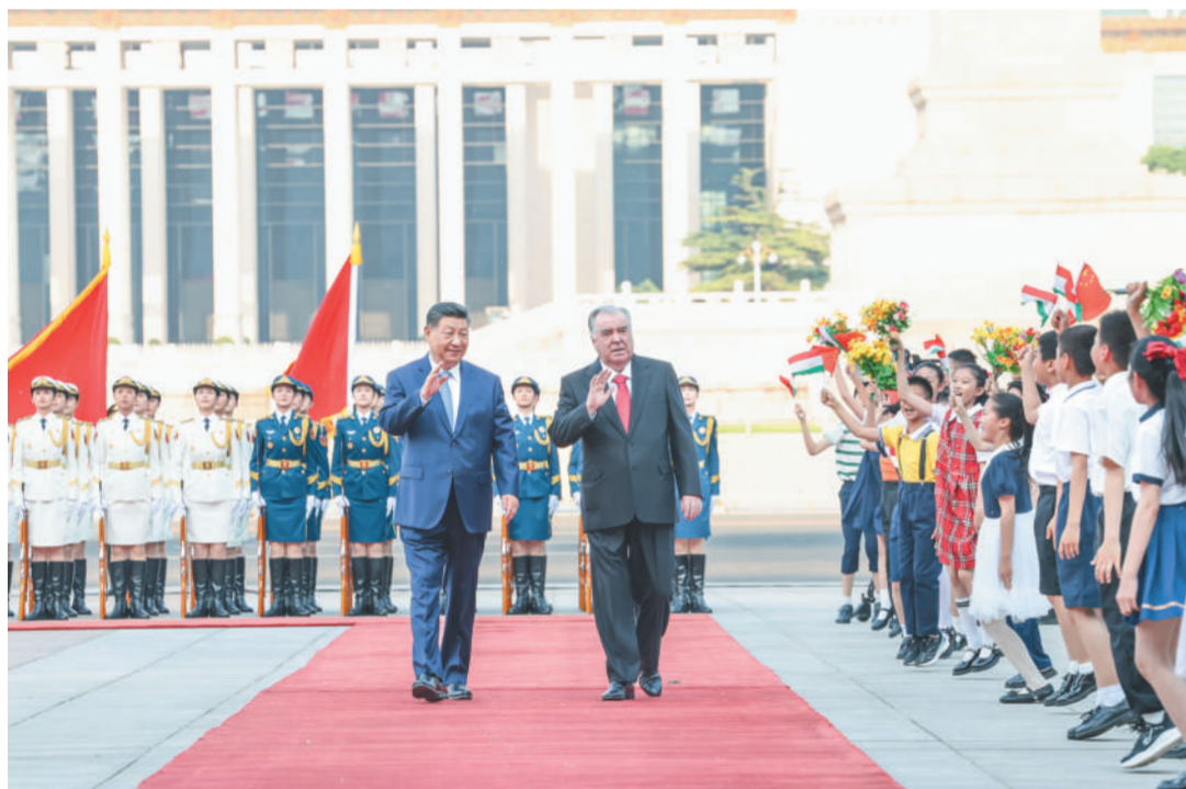
五月十二日下午,国家主席习近平在北京人民大会堂同来华进行国事访问的塔吉克斯坦总统拉赫蒙举行会谈。这是会谈前,习近平在人民大会堂东门外广场为拉赫蒙举行欢迎仪式。