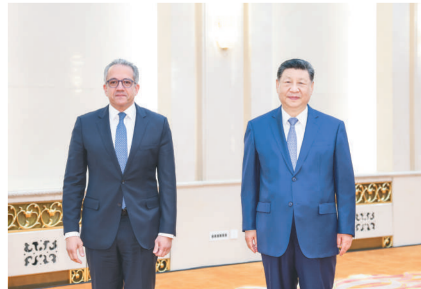
5月12日下午,国家主席习近平在北京人民大会堂会见联合国教科文组织总干事阿纳尼。

新华社北京5月12日电(记者 温馨)5月12日下午,国家主席习近平在北京人民大会堂会见联合国教科文组织总干事阿纳尼。 习近平指出,联合国教科文组织为增进各国人民相互了解信任、推动不同文明交流互鉴作出了重要贡献,也为改革完善全球教育、科学、文化治