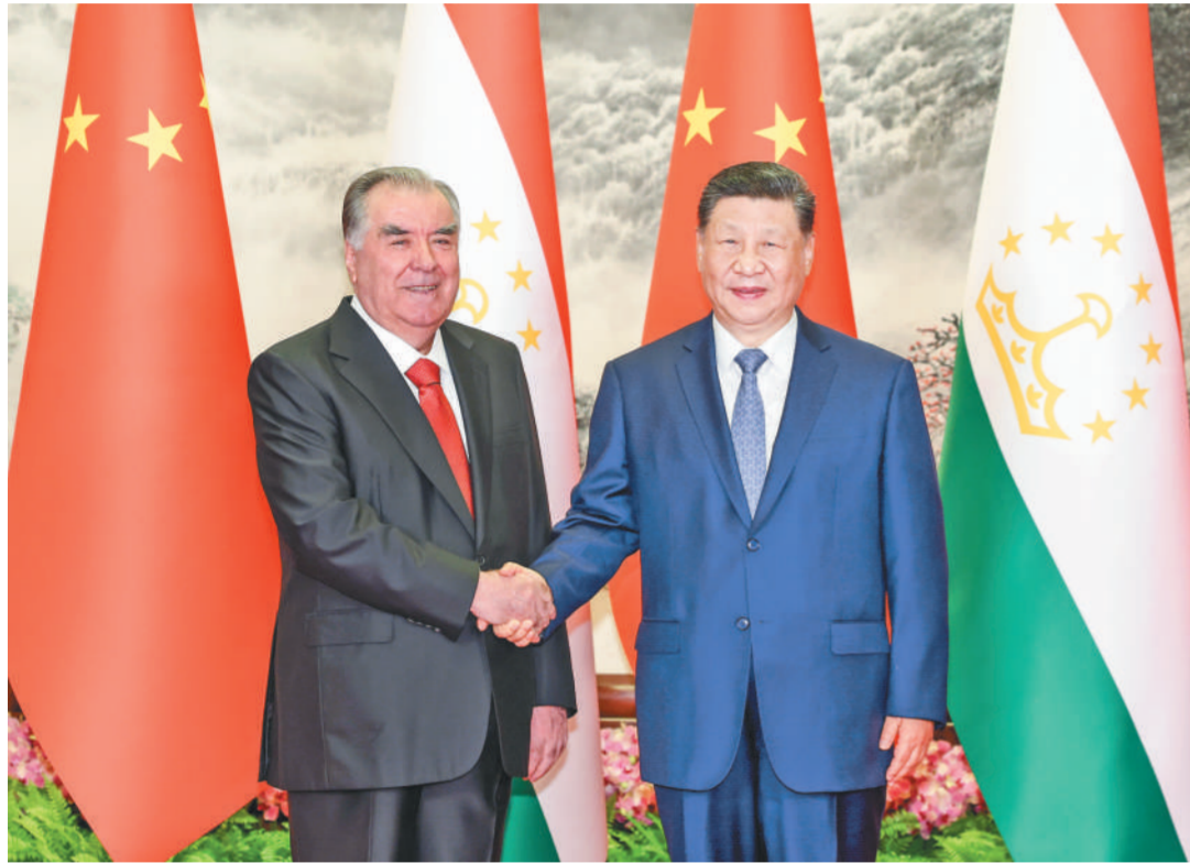
五月十二日下午,国家主席习近平在北京人民大会堂同来华进行国事访问的塔吉克斯坦总统拉赫蒙举行会谈。