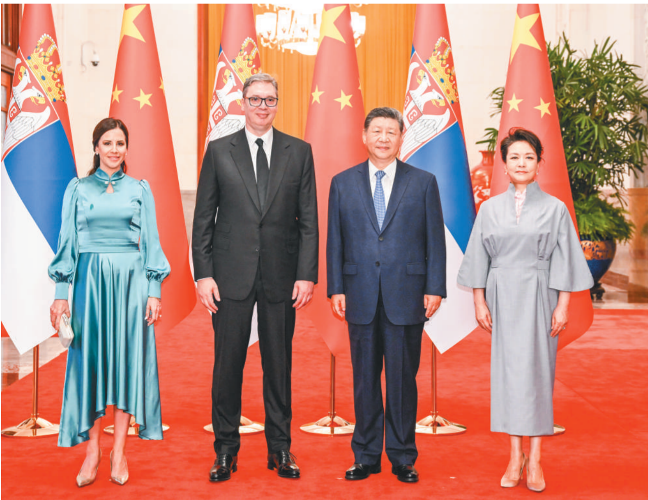
5月25日下午,国家主席习近平在北京人民大会堂同来华进行国事访问的塞尔维亚总统武契奇举行会谈。这是会谈后,习近平和夫人彭丽媛同武契奇和夫人塔玛拉合影。