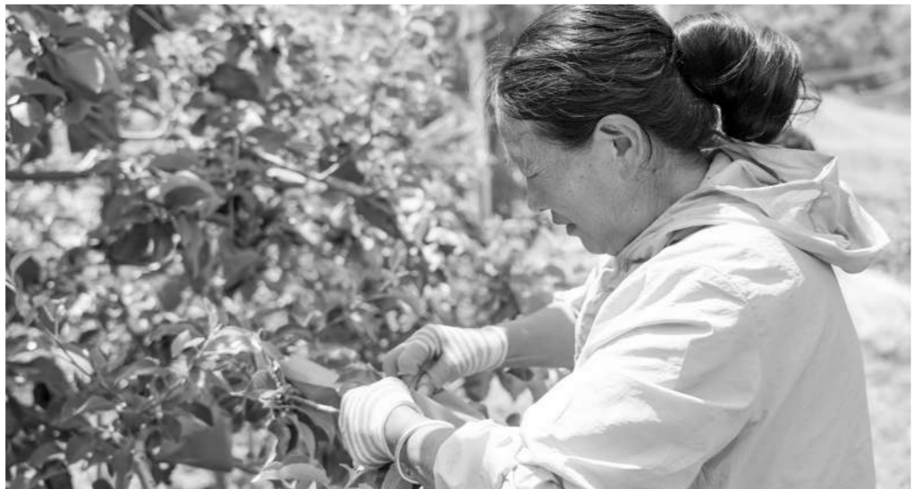
村民正在为苹果套袋。