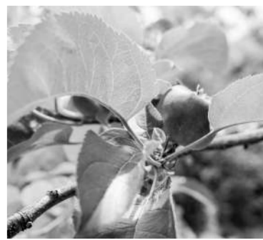
长势喜人的丹巴苹果。