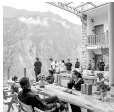
宝生居民宿中庭。受访者供图