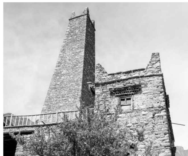
红五军政治部旧址。