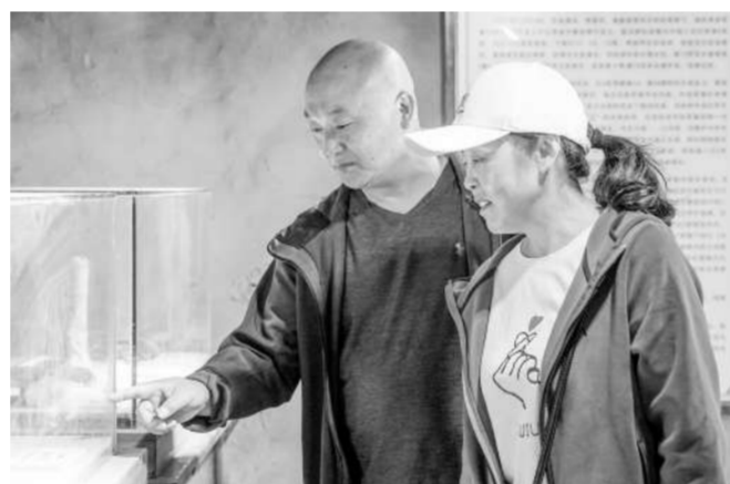
游客打卡红五军政治部旧址。