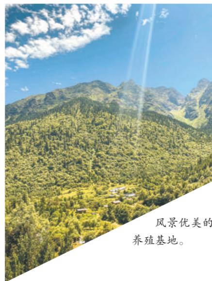
风景优美的养殖基地。

“一人富不算富，大家富才是真的富。”这是她创业以来始终坚守的初心与信念。身兼养殖协会会长、家乡青年带头人双重身份，她从未只顾自身发展，而是一心带动村民共同致富。为了降低农户养殖门槛，助力乡民增收，她常年无偿分享养殖技术，定期开办免费养殖培训班，用通俗易懂的语言讲解野香猪养殖、防疫、管护知识；针对养殖经验匮乏、行动不便的农户，她亲自上门手把手指导，解决农户养殖过程中遇到的各类难题。同时，她为合作农户提供优质纯种猪苗，签订回收协议，兜底收购成品生猪，彻底打消农户的销售顾虑，并且优先吸纳本地闲置劳动力进入基地就业，从技术、种苗、销路、就业多维度搭建帮扶体系，全方位助力村民增收。