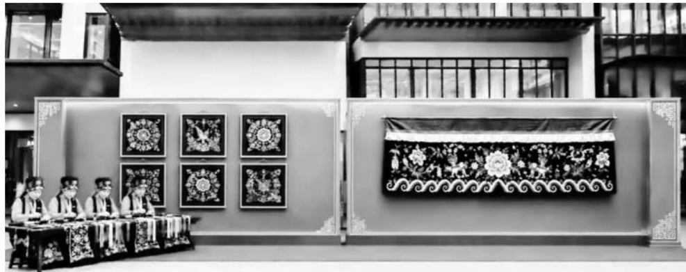
非遗代表性传承人现场展演鱼通刺绣。

为倾听群众意见，施工方设立24小时服务热线，在项目部设立居民接待室，建立诉求闭环机制，将群众意见建议融入施工细节调整。地下管网改造同样是道坎。田野表示，地下70年老旧水管一碰即破，自建