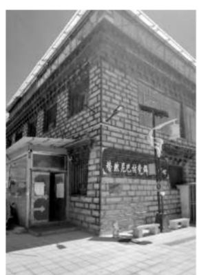
↑替然尼巴村平坦整洁的村道。 ←替然尼巴村活动中心。

道路贯穿全村，藏式民居错落有致，垃圾分类设施整齐摆放，街巷干净整洁。依托“全域无垃圾·理塘更美丽”行动，村里联合多部门开展联合整治，成立环境综合治理小组，建立常态化督查奖惩机制，彻底告别了昔日脏乱差的旧貌。