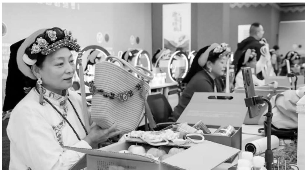
村民直播推介农特产品。

项目从一根中国结红绳起步。金东区依托“小商品之都”的市场优势，将中国结编织技艺引入丹巴，同时把培训重点放在直播营销能力上。浙江高校教师、企业家、直播达人组成的讲师团深入乡村，开展“藏家巧娘直播+”集中培训30期，并采取乡镇轮训、入户教学方式，实现全县覆盖。培训内容涵盖镜头表达、产品讲解、互动技