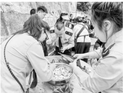
趣味包粽子大赛现场。