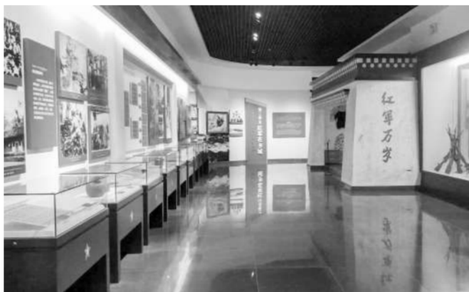
乡城县红军长征纪念馆重要展览。

在第一单元，有一幅红军长征路线图吸引了记者的视线。凑近细看，一条曲折的红色线条从江西瑞金出发，蜿蜒穿过大半个中国，最终抵达陕北。在川西高原的位置，记者找到了一个很小的圆点——