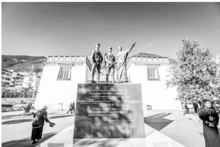
乡城县红军长征纪念馆雕塑（喜迎红军）。