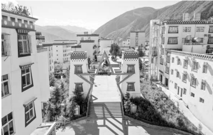
乡城县红军长征纪念馆代表性建筑。