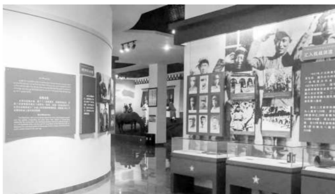
乡城县红军长征纪念馆重要展览。

“纳瓜活佛带领部分僧侣，前往离县城5公里处的边边哨村，手捧哈达迎接红军。他还告知四乡百姓，不向红军开枪，为红军做好人驻粮草的准备。”拥中说。于是，广场上出现了雕塑所刻画的那个场景：群众把家里的粮食用牦牛、驮到寺院，堆得像小山一样，迎接红军将士。